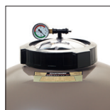
Ouverture fileté ø 180 mm pour faciliter les opérations de maintenance