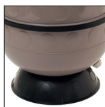
Socle circulaire pour une parfaite stabilité du filtre