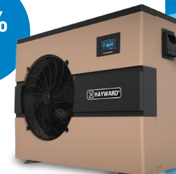
EnergyLine® Pro Inverter