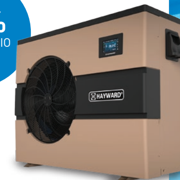
EnergyLine® Pro Inverter