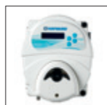
Regulador pH EZ-Chem

Posibilidad de diagnóstico on line accediendo al sitio www.hayward.es espacio Servicios