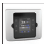
Abnehmbares Gehäuse optional