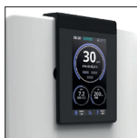
Pantalla táctil opcional (Touch Screen)