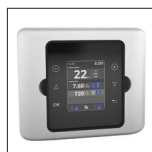
Panel de control a distancia