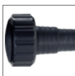
Uscita da 50 mm o adattatori dentellati \varnothing 32/38 mm