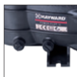
Tappi per lo scarico che facilitano il ricovero invernale