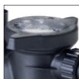
Pratica apertura del prefiltro: basta ruotare il coperchio di un quarto di giro