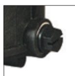
Taponos de vaciado que facilitan el invierno