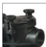
Tapa de prefiltro transparente