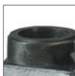
Salida de 1.5"