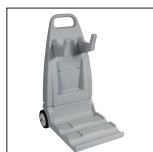
Carro ergonómico en opción RC99385. El carro permite desplazar y guardar el limpiafondos rápidamente y con total seguridad.