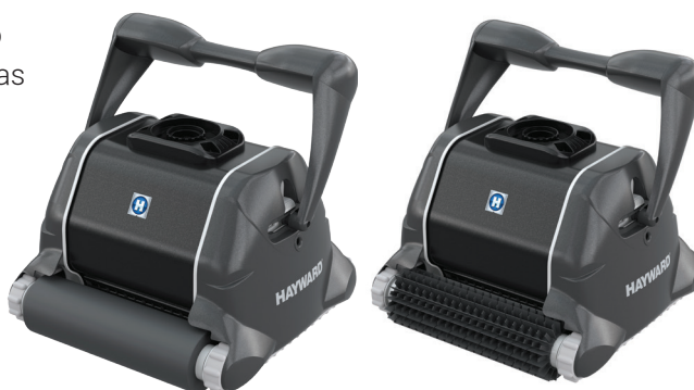
TigerShark® XLQC versión cepillo de espuma