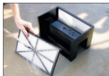
Paneles filtrantes que se retiran, se limpian y se montan fácilmente.