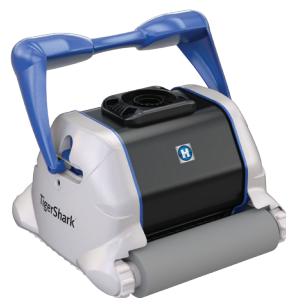
TigerShark® versión cepillo de espuma