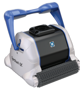
TigerShark® QC versión cepillo de plástico