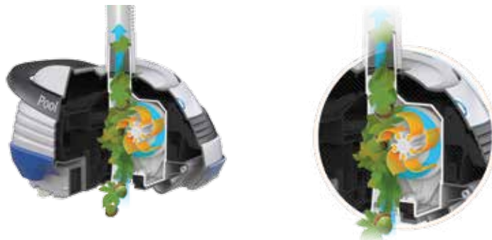
Tecnologia patenteada V Flex™: turbina de pás móveis para captar os detritos grandes

O desenho das asas permite-lhe melhorar a aspiração de todos os tipos de detritos