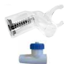
Debietindicator en regelklep