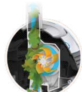
V Flex™ gepatenteerde technologie: turbine met mobiele schoepen voor het opvangen van grof vuil