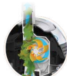
Tecnologia brevettata V-Flex™: turbina a pale mobili per l'aspirazione di detriti grandi