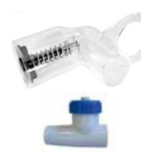
Misuratore di flusso e valvola di regolazione