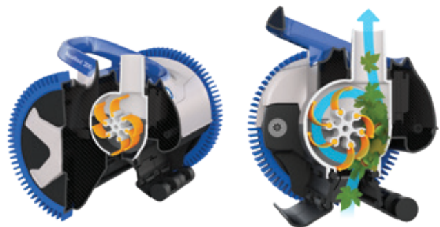
Tecnología patentada V-Flex™: turbina de álabes móviles para capturar los residuos grandes