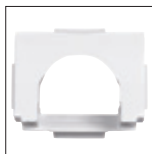
Boca de aspiración ancha

Adaptada a la mayoría de los sistemas de aspiración.