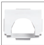
Boca de aspiración mediana

Para tener una aspiración mejor con un caudal más bajo, a utilizar con una bomba de velocidad variable, velocidad lenta.