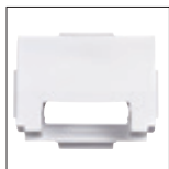
Pequeña boca de aspiración

Para tener una aspiración mejor con un caudal más bajo, a utilizar con una bomba de velocidad variable, velocidad lenta.