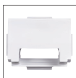
Pequeña boca de aspiración

Para tener una aspiración mejor con un caudal más bajo, a utilizar con una bomba de velocidad variable, velocidad lenta.