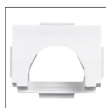
Boca de aspiración mediana

Para tener una aspiración mejor con un caudal más bajo, a utilizar con una bomba de velocidad variable, velocidad lenta.