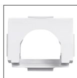
Boca de aspiración ancha

Adaptada a la mayoría de los sistemas de aspiración.