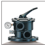
Het zand is gemakkelijk bereikbaar dankzij de uitbouwklep