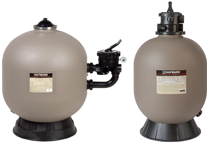
Pro-Series™ HB Side