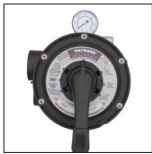
Vari-Flo™ klep met 6 standen