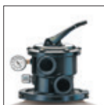
Sabbia facilmente accessibile grazie al collare di smontaggio