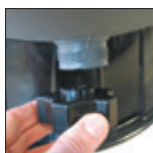
Tubo munito di tappo di grandi dimensioni, utile per lo smontaggio