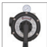
Valvola Vari-Flo™ 6 posizioni