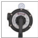
Válvula Vari-Flo™ 6 posiciones