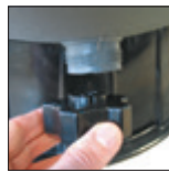
Tubo de desagüe con su tapón, de gran dimensión que sirve como herramienta de desmontaje