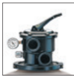
Arena fácilmente accesible gracias al collarín de desmontaje