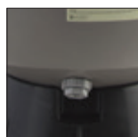
Tapón de purga que facilita el mantenimiento