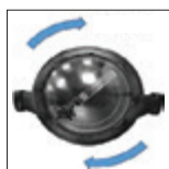
Cierre twist-lock, acceso rápido sin herramientas