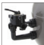
Válvula 6 posiciones, con manómetro integrado