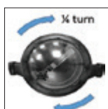
Twistlock-System für einfaches Öffnen