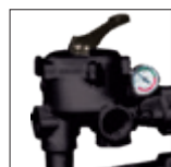
Valvola a 6 posizioni con manometro integrato