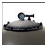
Grande apertura dall'alto per facilitare le operazioni di carico della sabbia