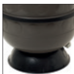
Base circular, para una estabilidad perfecta del filtro