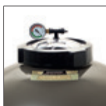
Abertura de rosca \varnothing 180 mm, para facilitar las operaciones de mantenimiento