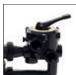
Válvula 6 posiciones