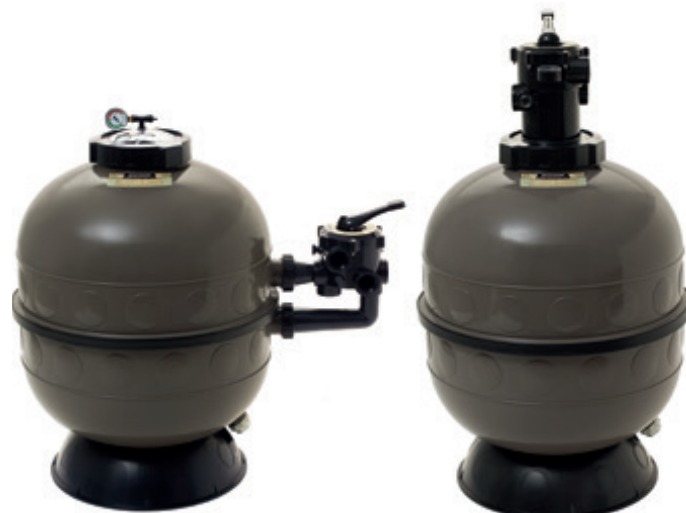
Pro-Series™ HI Side