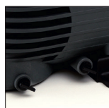
Double purge, ouverture facile sans outillage