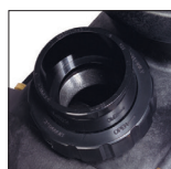
Raccords unions fournis (50/63 mm)