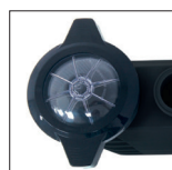
Couvercle de préfiltre Twist-Lock transparent