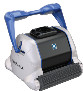
Tigershark QC® version picot