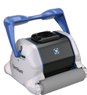
TigerShark® version mousse