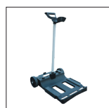
Caddy inclus Le chariot permet de déplacer et de stocker le robot rapidement et en toute simplicité.