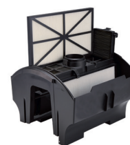
Accès au panneau filtrant par le dessus. Entretien facile. Le panneau filtrant est facile à enlever, facile à nettoyer et facile à remettre.