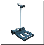
Transportwagen inklusive mit dem Wagen wird der Reinigungsroboter schnell und einfach transportiert und wieder verstaut.