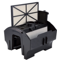
Zugang zu den Filterplatten von oben. Einfache Pflege. Die Filterplatte lässt sich leicht entnehmen, reinigen und wieder einsetzen.