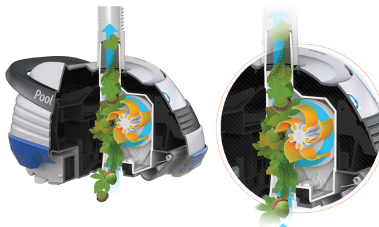
Tecnologia brevettata V-Flex®: turbina a pale mobili per l'aspirazione di detriti grandi

Il design delle ali gli consente di migliorare l'aspirazione di qualsiasi tipo di detriti