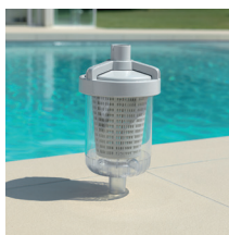
Trappola per foglie