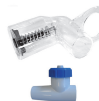
Misuratore di flusso e valvola di regolazione