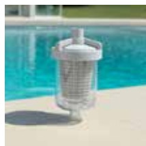
Piège à feuilles