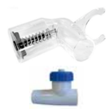
Unterdruckmesser und Regelventil