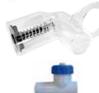
Debitindicator en regelklep