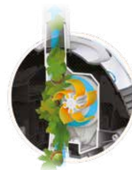
V Flex ™ gepatenteerde technologie: turbine met mobiele schoepen voor het opvangen van grof vuil