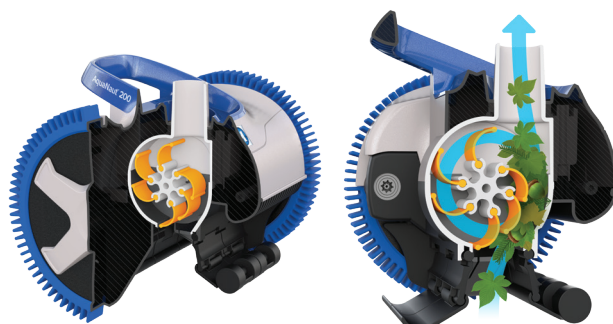
V Flex™: turbine met mobiele schoepen voor het opvangen van grof afval