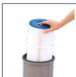
Elemento filtrante fácil de retirar