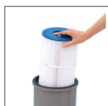
Elément filtrant facile à retirer