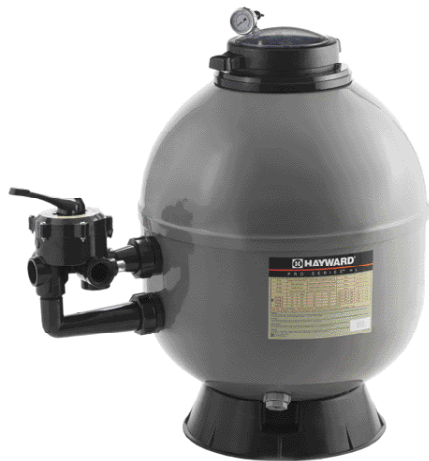
Pro-Series HL TL Side

Uma hidráulica otimizada para uma filtração de grande qualidade