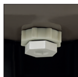
Bujão de purga que facilita a manutenção