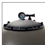
Grande abertura em cima para facilitar o carregamento da areia