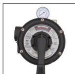
Valvola Vari-Flo™ 6 posizioni