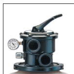
Sabbia facilmente accessibile grazie al collare di smontaggio