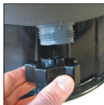
Drain avec son bouchon de grande dimension servant d'outil de démontage