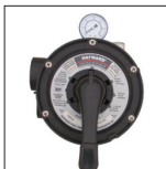
Vanne Vari-Flo™ 6 positions