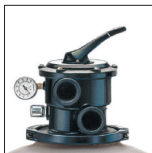
Sable facilement accessible grâce au collier de démontage