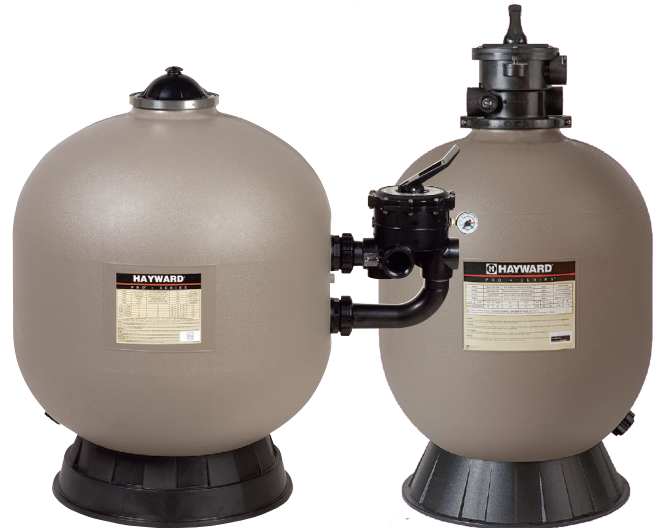
ProSeries™ HB Side