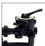
Válvula de 6 posições