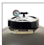
Abertura rosçada com \varnothing 180 mm para facilitar as operações de manutenção