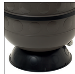
Rond onderstel voor een perfect stabiel filter