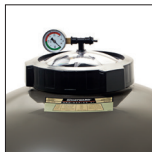
Draadgat van ø 180 voor vereenvoudigde onderhoudswerkzaamheden