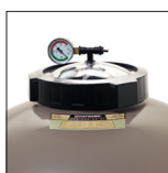
Abertura de rosca \varnothing 180 mm, para facilitar las operaciones de mantenimiento