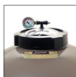
Mit einem Gewinde versehene Öffnung ø 180 mm für einfachere Wartungsarbeiten