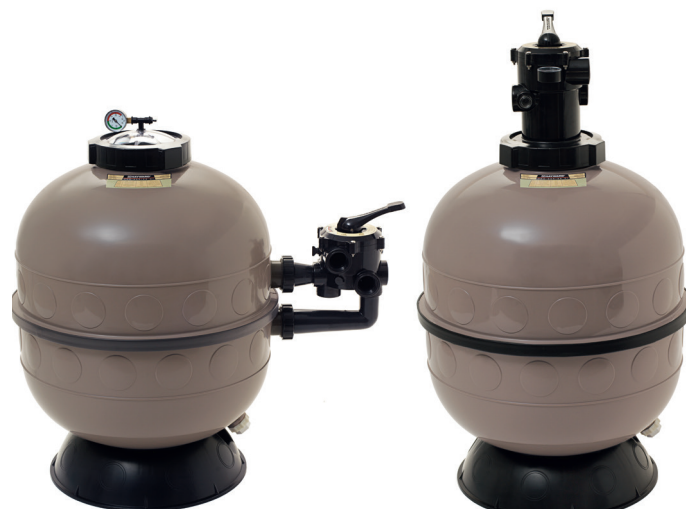
ProSeries™ HI Side