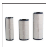
Cartouches de remplacement