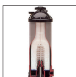
Filtre découpé Star Clear