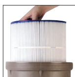
Facile à nettoyer