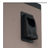
Conexión eléctrica sencilla