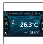
Nueva interfaz de usuario, intuitiva y muy informativa