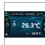
Neue intuitive und sehr informative Benutzerschnittstelle