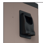
Vereinfachter elektrischer Anschluss